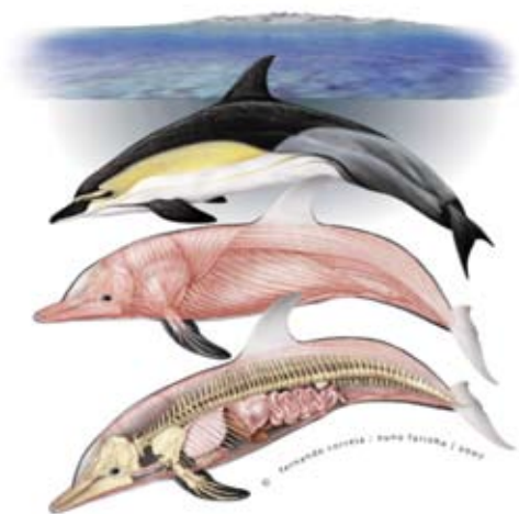
Cetáceos - dos Arrojamentos à Investigação”