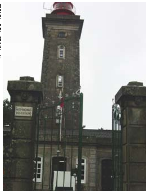
Farol do Montedor