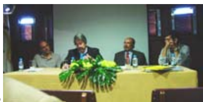
Comemorações do Dia do Mar